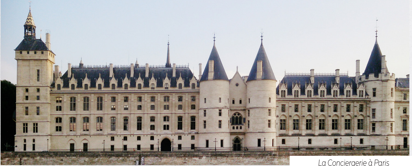
La Conciergerie à Paris