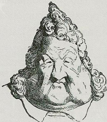
Alors il faudra condamner celui-ci, qui ressemble au premier.