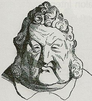
Ce croquis ressemble à Louis-Philippe, vous condamnez donc ?

Si, pour reconnaître le monarque dans une caricature, vous n'attendez pas qu'il soit désigné autrement que par la ressemblance, vous tombez dans l'absurde. Voyez ces croquis informes, auxquels j'aurais peut-être dû borner ma défense :