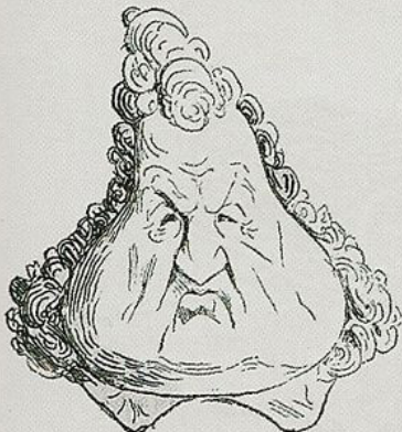
Puis condamner cet autre qui ressemble au second.