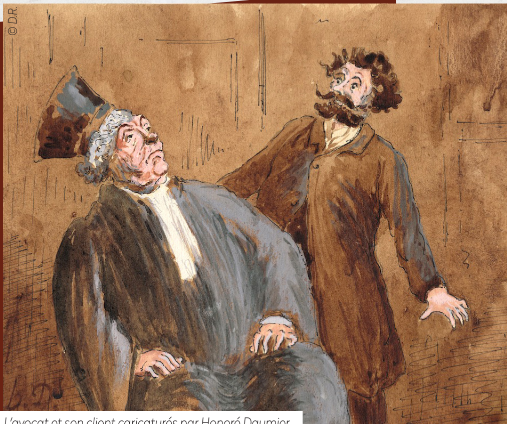
L'avocat et son client caricaturés par Honoré Daumier